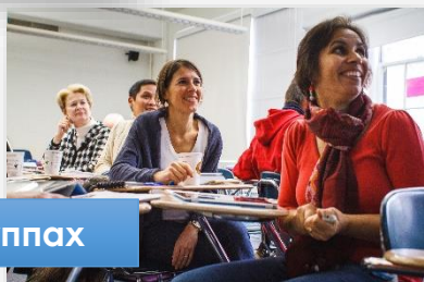
Работа в группах